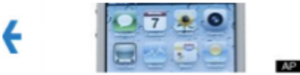
White iPhone 4 Shelf Space Spotted