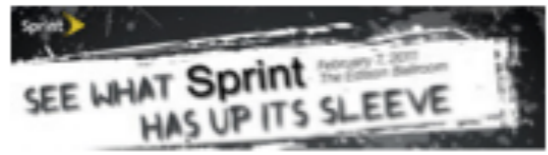
Sprint To Unveil Tablet-Like Phone?